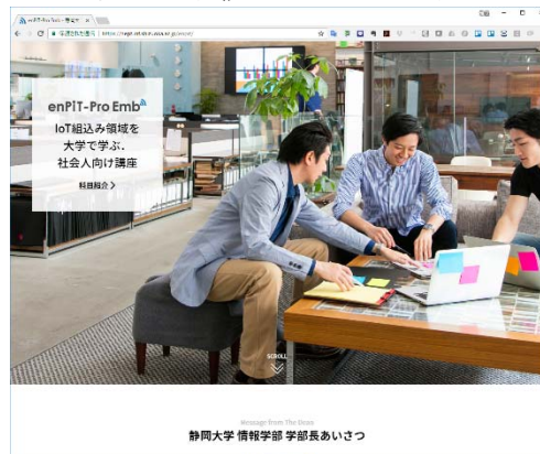
図4 IoT 組み込みシステムコース