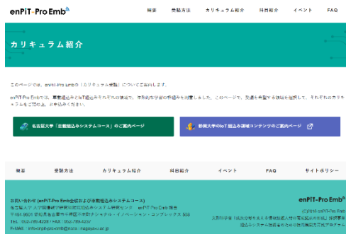
図2 車載/IoT コース選択