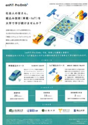
図5 enPiT-Pro Emb のチラシ